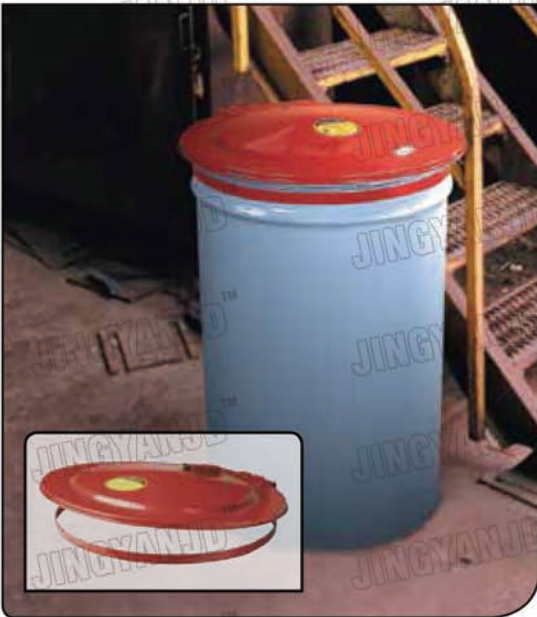
红色盖子颜色醒目，加强安全防护。