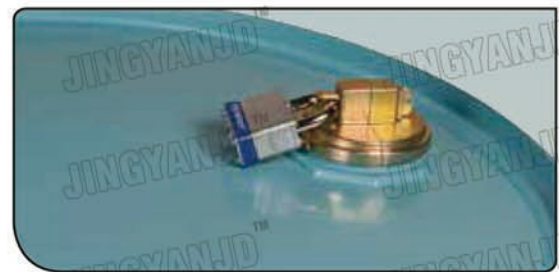
桶盖可锁，防止未授权使用。

桶锁是一种经济实惠的方法，既能封闭内容物、减少被盗和破坏的发生，还能保证仅由经授权的人员使用。由耐腐蚀、不产生火花的压铸材料制成，可轻松安装在桶孔塞法兰周围。由于无需将原孔塞取下，内容物不会遭受污染。